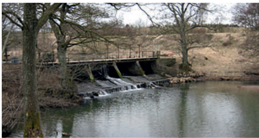
Sådan så opstemningen ud på det gamle foto ved Vilholt Mølle før den blev fjernet i 2008.

En relativt pæn bestand er nu 5-doblet på få år, idet der er mange levesteder for