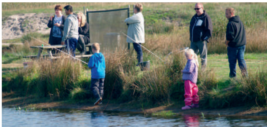
Børn og voksne hygger sig sammen på deres fisketur.

kunder og andre turister fra f.eks. Polen og Letland. De fleste er nok lidt lokale, f.eks. kommer der mange fra Holstebro, Skive, Struer og Lemvig, og det er folk i alle aldre.