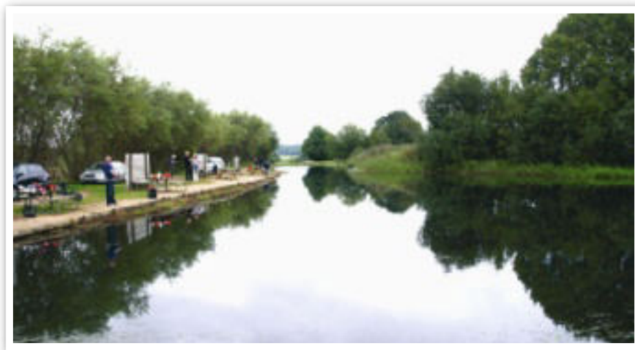
Grumstrup Lystfiskerpark ligger i naturskønne omgivelser.

- Det er nok fordi, jeg mener, de besøgende skal kunne fange de fisk, de har mulighed for at fange. Jeg ved