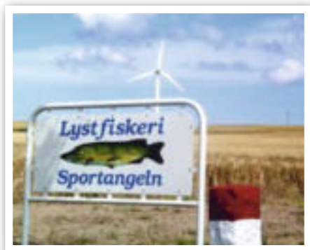
Skiltet ved Knarregårdsvej 15 gør det let at finde frem til lystfiskerparadiset.

naturen, for han har også konstateret, at mange af dem, der kommer til Krusegården for at drive lystfiskeri, først og fremmest kommer for at nyde naturen, så måske vil det ikke være nogen dårlig ide at etablere et lystfiskerparadis, der udelukkende er baseret på naturen.