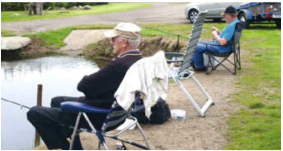
Lystfiskeri kan også være afslapning og en kølig dåseøl.

Grumstrup Lystfiskercenter er beliggende i et spændende naturområde med stort kildevæld på Hedemølle Kirkevej ved Hovedgård – ikke så lang fra den gamle landevej mellem Horsens og Århus.