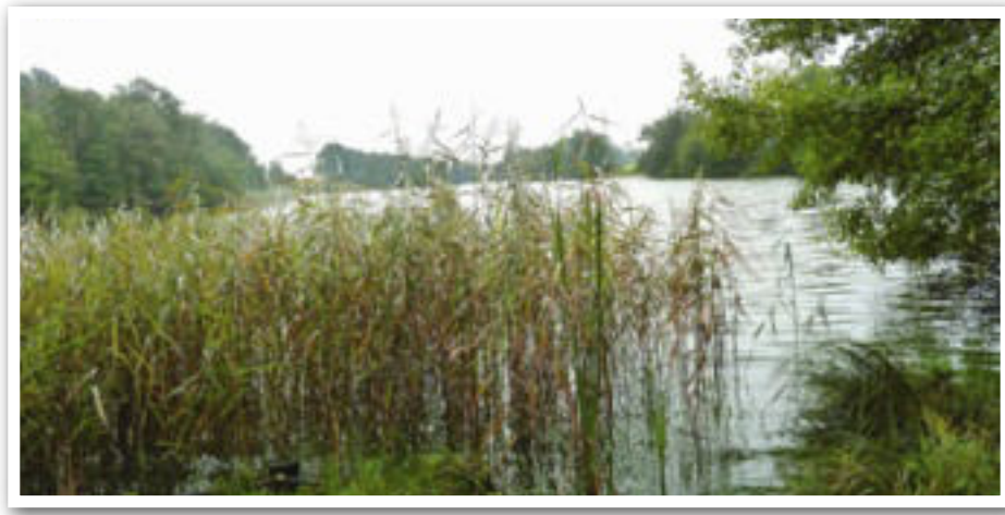
Flere tyske turister kommer til fiskesøen her – først og fremmest for at nyde naturen.

sættefisk fra Sverige, men tidligere fik jeg dem fra Grenå, hvor opdrættet imidlertid nu er standset.