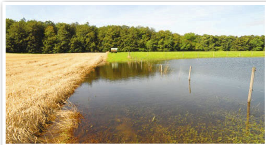
Skybrudsramt mark.