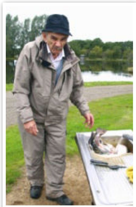
Den bosniske lystfisker må løbe i pendulfart mellem rensesed og fiskested – han har netop fanget regnbueørred nr. 9.

Vi ved det jo godt - alle os, der har forsøgt os som lystfisker – at der er et eller andet med held, dygtighed eller erfaring, men på "Fiskens Dag" den 10. september var der alligevel grund til undren over en lystfiskers formåen i Grumstrup Lystfiskercenter ved Skanderborg.