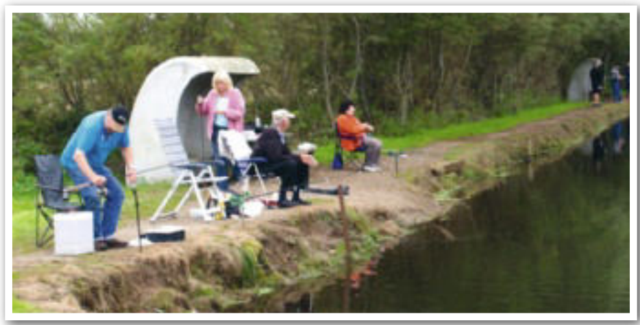
Det var tredje gang på én uge, de hollandske lystfiskere besøgte Grumstrup.

allerede er i søerne, måske er lidt for dvaske i sommervarmen.