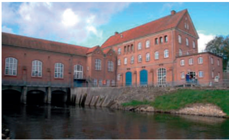
Tangeværket er endnu engang blevet aktuelt på Christiansborg.

Et tilsagn der blev givet til Folketingets Miljøudvalg den 26. november 2013 som svar på Ferskvandsfiskeriforeningens henvendelse til samtlige folketingsmedlemmer af 23. november omkring Tangeloven.