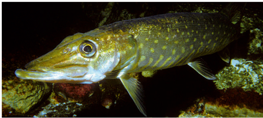
Gedde opsnapet af DTU Aquas undervandskamera.

Projektet er betalt af fisketegnsmidlerne og er udarbejdet i samarbejde mellem