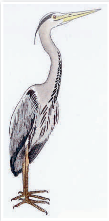
Fiskehejren betegnes i en populær fuglebog fra 30'erne som en almindelig dansk ynglefugl.

Fra kun at have været et besøgsmaal for skarver etablerede skarvkolonien sig ved søens bred sidst i 1990'erne. Samtidig med at skarvkolonien voksede, faldt antallet af gydebanks i bækkene. I samme tidsrum voksede hejrekolonien også, dog ikke så markant.