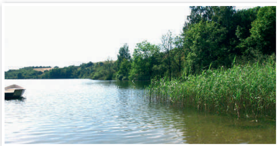
Rekreativt fiskeri skaber også spændende miljøer og isolerede vande – som f.eks. søer, der skal være i naturlig balance.