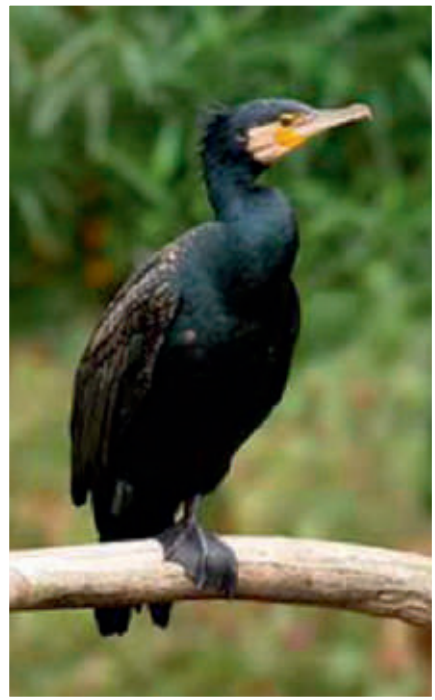
Skarven tog godt for sig af søørrederne i Hald Sø.

Bådelaug, undersøgt hvor mange fisk skarv og hejre spiser i Hald Sø. I Undersøgelsen, der strakte sig fra 2008-2011, blev der mærket ca. 3500 ørreder over 12 cm.