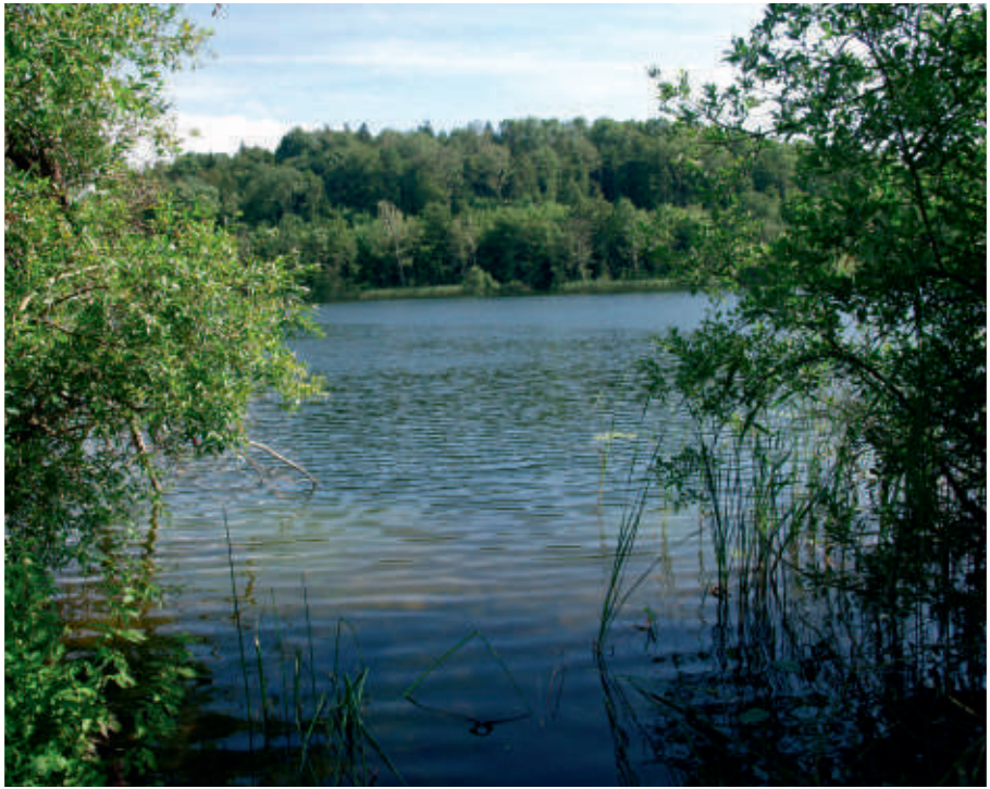
Søørreden har det svært i Hald Sø.

Efter en hård vinter i 2010, hvor skarv og fiskehejre havde svært ved at finde føde, er antallet af skarv og fiskehejre reduceret. Hvilket ser ud til at have medført en stigning i antallet af gydebanker.