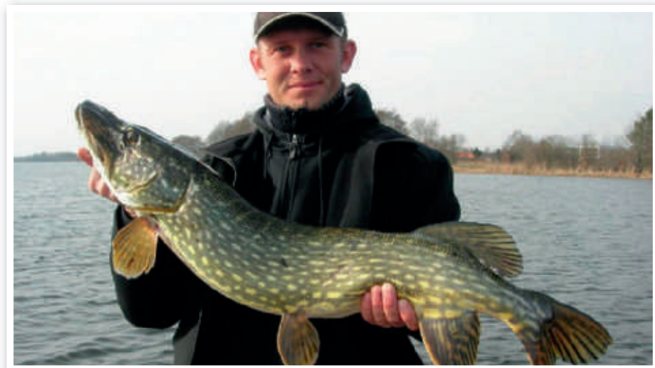
En rigtig flot gedde – dog ikke fra Tryggevælde Å.