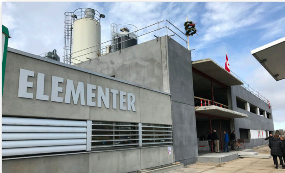
Den nye administrationsbygning i Nr. Snede.

LANDBRUG & FØDEVARE på Axelborg fortæller, at der siden 2005 er introduceret såkaldte modellandbrug i dansk fiskeop-