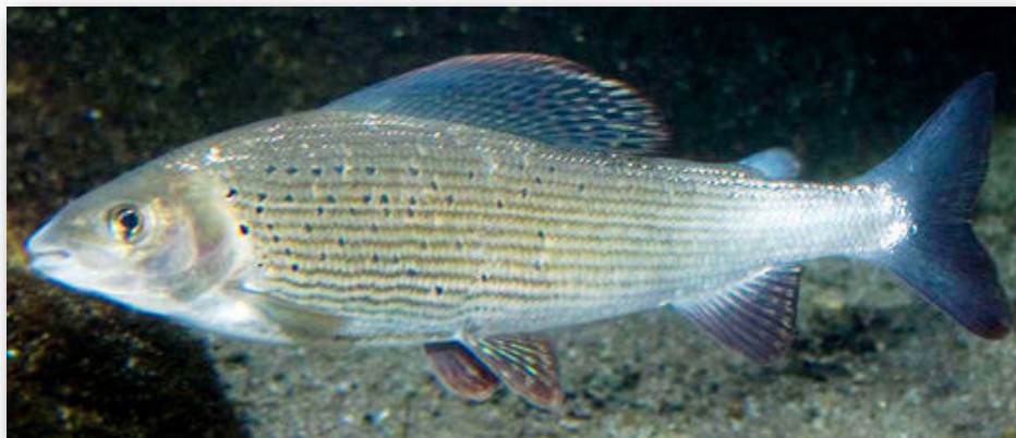
Stallingen er let kendelig på sin lange og høje rygfinne. Den kan veje op til 3,6 kg. og kan blive 60 cm. lang.

Generelt er der stadig kun meget små bestande i de fleste vandløb, men bl.a. i Grindsted Å og Sdr. Omme Å ser det ud til, at bestandene er forbedrede. Det er dog ikke muligt at sige, om de er ved at nærme sig niveauet fra før 2010, og om bestandene er stabile.