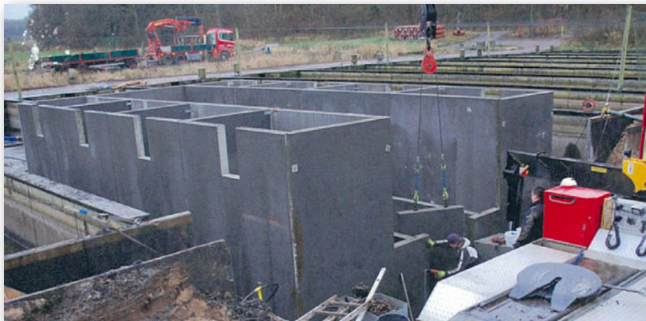
Det nye anlæg i Løjstrup er opbygget i det oprindelige damanlæg, ligesom i Rindsholm af Give Elementers L-elementer.

dræt, hvor en stor del af vandet recirkuleres. Det betyder, at der kan produceres en større mængde fisk i det samme vand. Således bliver 95 pct. af vandet recirkuleret i modeldambrug type 3, hvor der hovedsageligt produceres portionsfisk på 300-350 gram til viderefærdig og udsætningsfisk til havbrug ca. 1 kg.