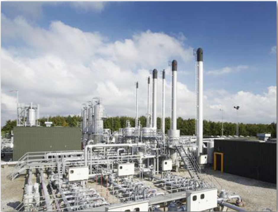
Naturgaslager Lille Torup

Jeg forstod derfor slet ikke, at ministeriet, der står bag de nye visioner for det fremtidig turist- lystfiskeri og lystfiskeriets