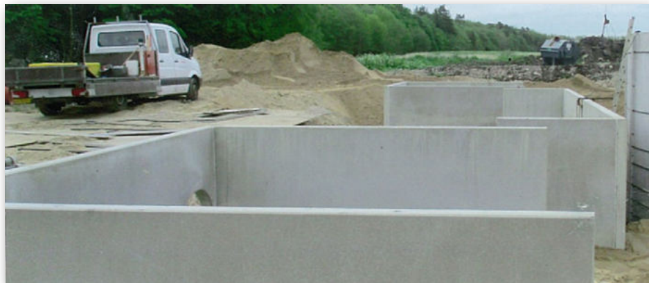
Nyt afgasnings-iltningsapparat hos Trend Dambrug.

iltningsanlæg på ca. 140 kvadratmeter i elementer med en højde på 4,5 meter. Projekteringen var her udført af Svend Poulsen A/S og arbejdet udført af hovedentreprisen Skibbild Entreprise A/S.