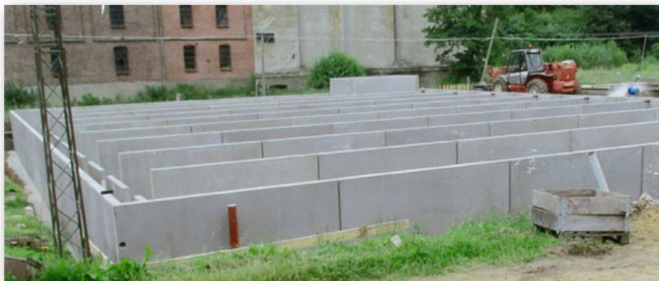
Nyt sættefisk anlæg og okkerfilter på Rindsholm.

Ved Halle Sø dambrug, som ejes af AquaSearch Ova Asp, er opført to hele nye ens damanlæg – hver med 10 damme og diverse filter og microsigterum på i alt 2200 kvadratmeter, der begge er opført