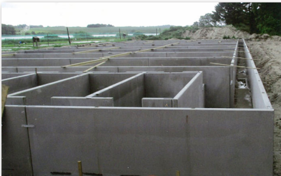
Her er det et nyt anlæg hos Hallesø Aqua Search. Hvor 1. etape af to ens anlæg er gennemført.

På Løgtstrup dambrug, der i den ældste del af dambruget, som i Rindsholm var udført af L-elementer med højde på 1,5 m., blev der efter fjernelse af nogle oprindelige elementer, opbygget helt nyt