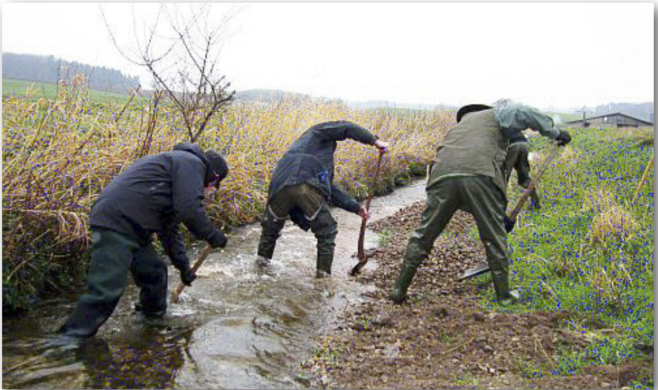
Frivillige har udført et stort arbejde

Derfor kan en fremtid for lystfiskere blive at der kun bliver tale om fiskeri, hvor der skal betales hver gang fiskestangen skal luftes, og i et vand uden fisk. Ønsker vi at det hundredårige foreningsliv der er omkring lystfiskerforeninger skal ophøre, og smarte forretningsfolk skal overtage lystfiskeri uden nogen kan/vil se hvad der sker?