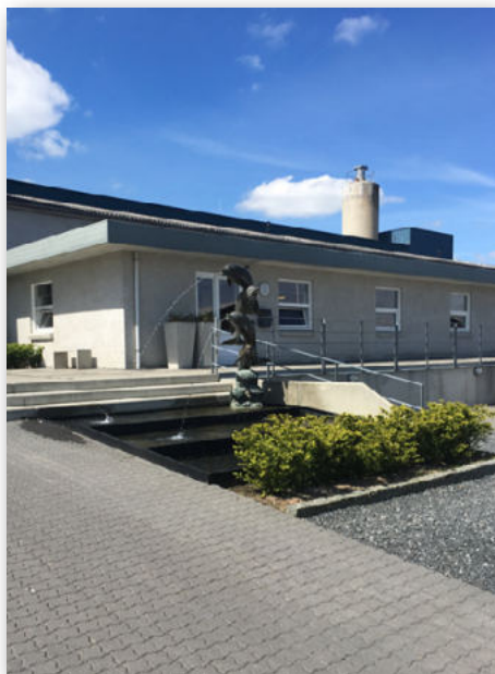
Renovering og udbygning af administrationen i Give.

Bl.a. til dette anlæg støbes der desuden hos samarbejdspartneren H.C. Beton-elementer A/S, både standardkegler og kegler med specielle udløb i beton, der grundet vægten gør det muligt at komme hurtigt videre med arbejdet.