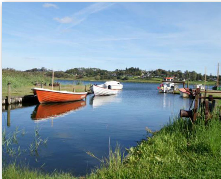
Hjarbæk Fjord, der efter planen skulle have tilført masser af udskyllet giftigt vand.

skuffet og utilfreds med, at hans forening ikke var blevet inviteret med til temadagen i Maribo den 24. marts, da startskuddet til det på forhånd stærkt