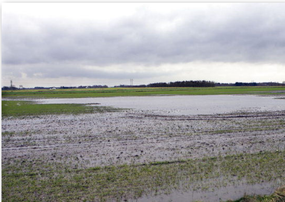
Det er ikke let at slå græs her og gøre marken klar til næste års afgrøde.

hårdt ramte landmænd mener at nyt sygehus, nye veje og boliger samt et meget fugtigt efterår er skyld i mange oversvømmede marker, som Aalborg Kommune ifølge de berørte landmænd ikke vil gøre noget ved.