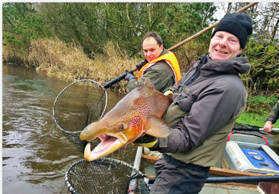
Elektrofiskeri på Grindsted Å