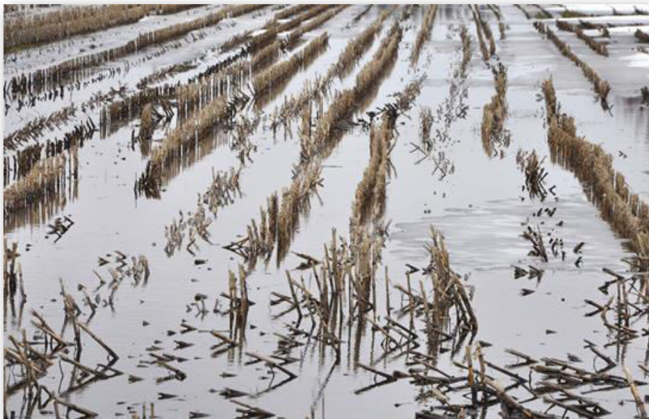
Denne majsmark nåede at blive høstet, men der blev ikke sået ny afgrøde til tiden.