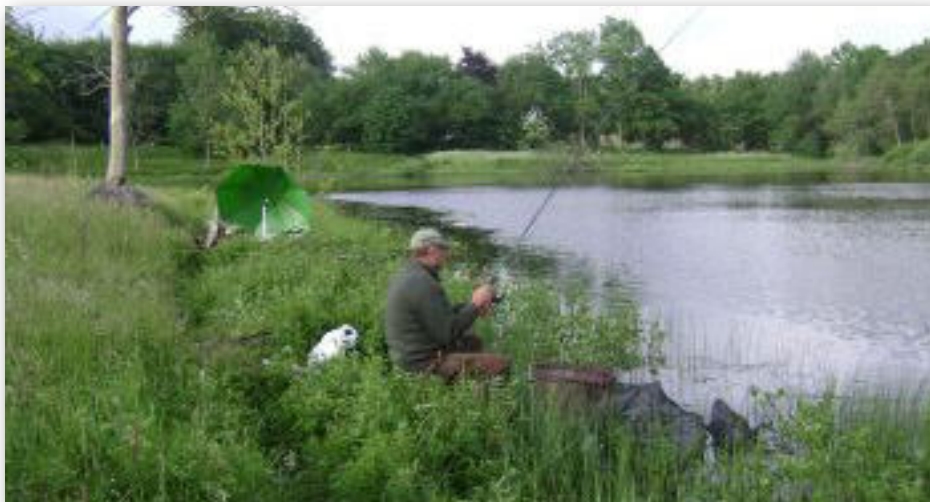
Det regnfulde vejr på Bornholm har givet gode forhold i øens åer og vandløb for ørredbestandene og dermed også gode fangster i havet omkring Bornholm