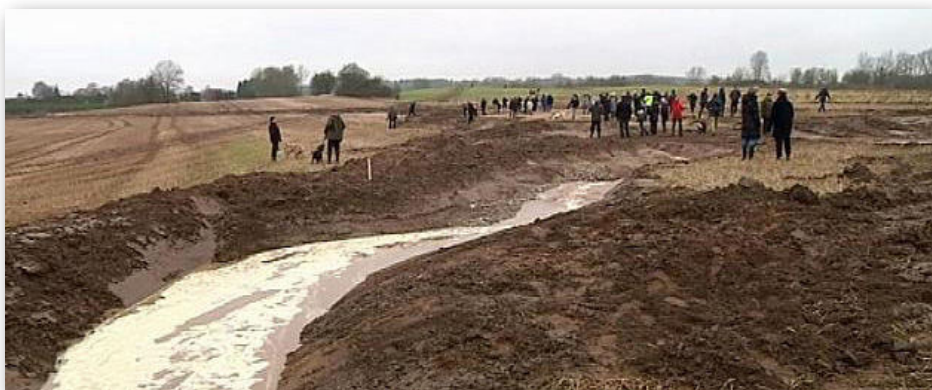
Et lille hundrede mennesker havde fundet vej til indvielsen af det nye vandløb den 20 januar.

Det nye naturområde er planlagt sammen med Naturstyrelsen og hele projektet ventes færdigt i løbet af den kommende sommer.