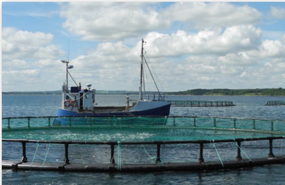
Hjarnø Havdambrug opdrætter ikke længere søvlaks

at området kommer under lup, siger Lene Tingleff.