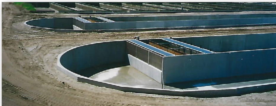
Her ses et andet projekt, nemlig fra Løvlund Dambrug, som har fire store og et mindre kummeanlæg med denne konstruktion. Løvlund Dambrug var også det første dambrug, hvor det nye brugsmødelbeskyttede slamkedelsystem i beton blev anvendt.

god indpas i en del nye dambrug, bl.a. grundet systemets enkle og konstruktion og høje vækst der holder keglerne nede, selvom der skulle være vandtryk, så opfyldning umiddelbart efter montage kan igangsættes.