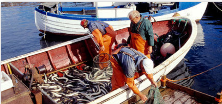
Det er fortsat tilladt at fange ål i Danmark.

I en fælleserklæring fra Kommissionen og medlemsstaterne blev det dog