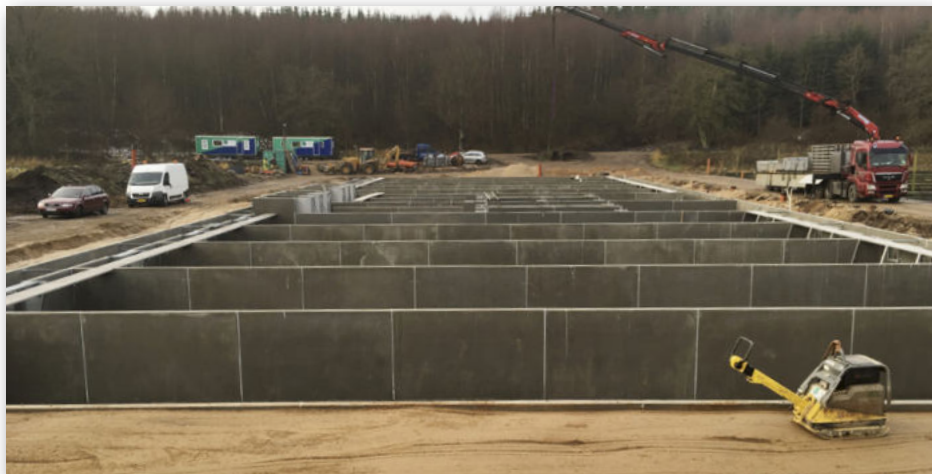
De ti kummers anlæg her, hvor Musholm Laks er flyttet på land i Løjstrup

På Løjstrup dambrug ligger i øvrigt også de første damme opført i en kombination af standardelementer og specielle buelementer, som senere er blevet lidt af