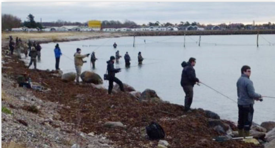
På Halsskov Rev ved Storebæltbroen blev der på det nærmeste "skovlet" regnbueørreder op efter et udslip i december i 2017.

Begge steder blev der på det nærmeste "skovlet" regnbueørreder op, og da Fiskerikontrollen også gerne ville kikke lidt med, endte det også med et rigtig pænt input til Statens bødekas se.