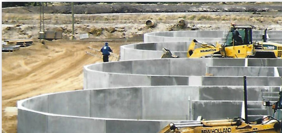
På Løjstrup Dambrug ligger også de første damme, opført i en kombination af standardelementer og specielle bueelementer fra Give Elementfabrik A/S.

et hit på andre dambrug, f.eks. Løvelund Dambrug som har fire store og et mindre kummeanlæg med denne konstruktion. Løvelund Dambrug var også det første dambrug, hvor det nye brugermodelbeskyttede, slamkedelsystem i beton blev benyttet, et system, der også har vundet