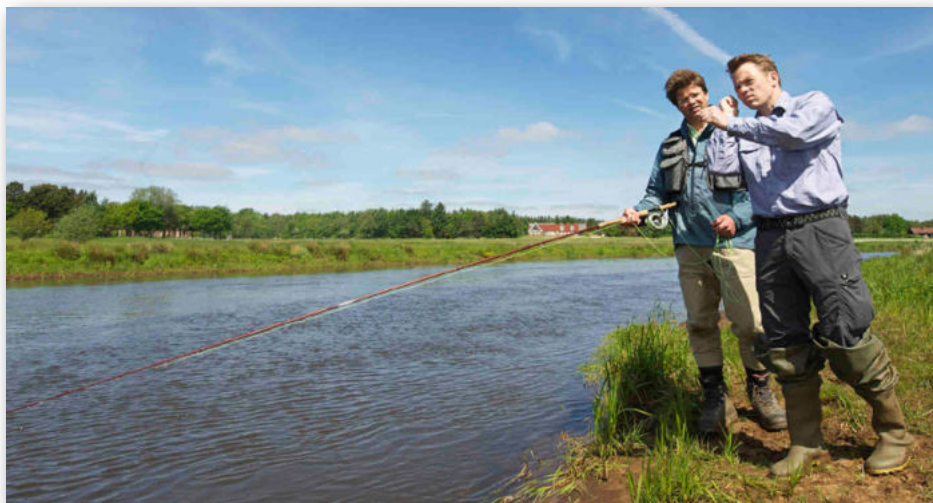
Fishing Zealand har satset meget på at "sælge" lokale fiskeguider.

Ydermere kan man i referatet læse, at det var forvaltningen i Center for Kultur,