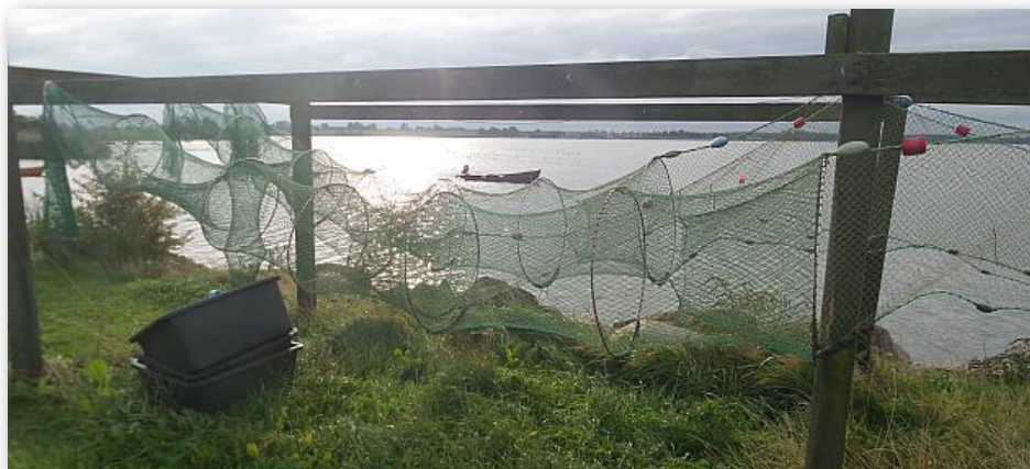
Åleruser hænger til tørre ved søens bred.

anerkendt, at bestanden af europæisk ål er i kritisk stand – igen ved ICES' seneste råd af 7. november 2017.