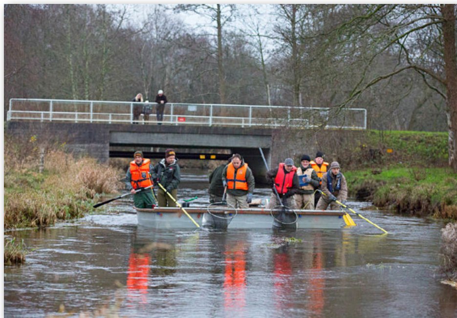
Fra et kursus i elektrofiskeri

Det er DTU Aqua, der under Fiskeplejen i samarbejde med Danmarks Sportsfisker-