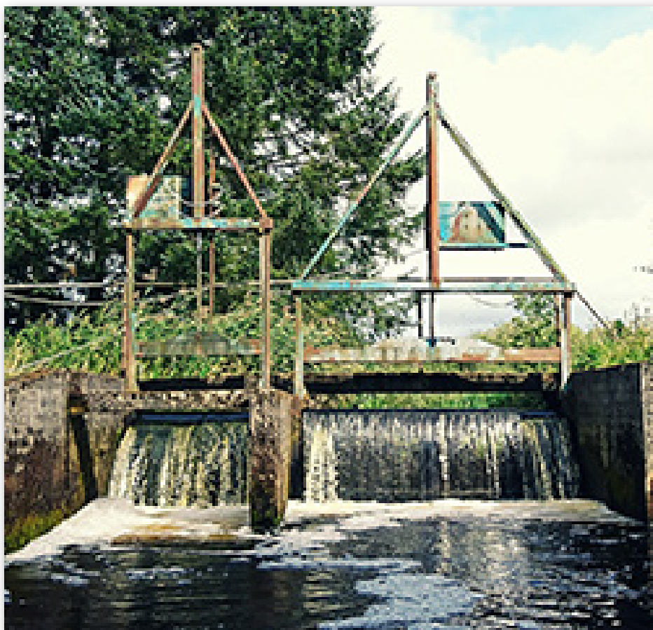
Her en opstemning – spærring af vandløb i Nordvesttyskland.

dæmninger, men også hundredetusinde af steder, hvor vandløb er spærret af mindre opstemninger lagt i rør eller lignende. Disse spærringer forhindrer fisk i at foretage vandringer mellem deres gyde- og opvækstområder, som er en forudsætning for, at fiskene kan gennemføre deres livscyklus.