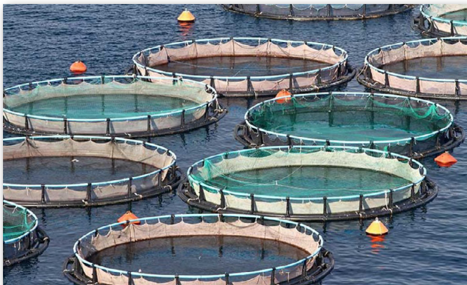
Det er dambrug til havs som disse, der er i modvind hos sportsfiskerne.

Det forudser Danmarks Sportsfiskerforbund også. De seks "ulovlige" fiskefarme ligger alle i eller nær sårbare Natura-2000 områder ved mundingen af Horsens Fjord og Lillebælt, og de mangler alle såkaldte placeringstilladelser.