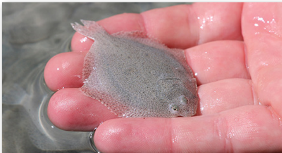
Vinderbilledet fra Danmarks Grundforskningsfonds fotokonkurrence 2020.

Fritids- og erhvervsfiske. Udsætningen finansieres af de penge, som kommer ind ved salg af fisketegn.