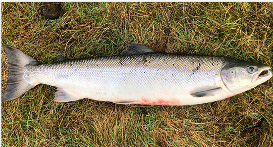
Laks med svag rødmende bug er tegn på, at fisken er ramt af Red Skin Disease.

DTU Aqua er med i et større internationalt netværk, som prøver at finde ud af, hvor stort problemet er, og hvad sygdommen skyldes.