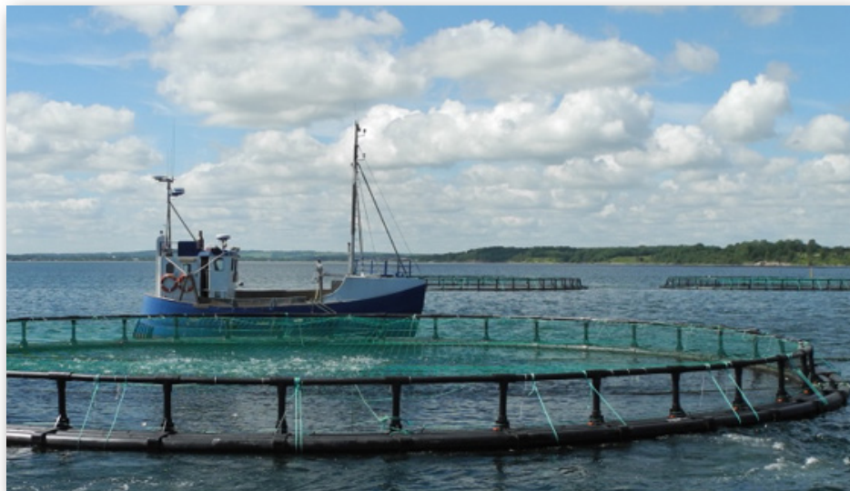
Foto fra Hjarnø havdambrug i Horsens Fjord.