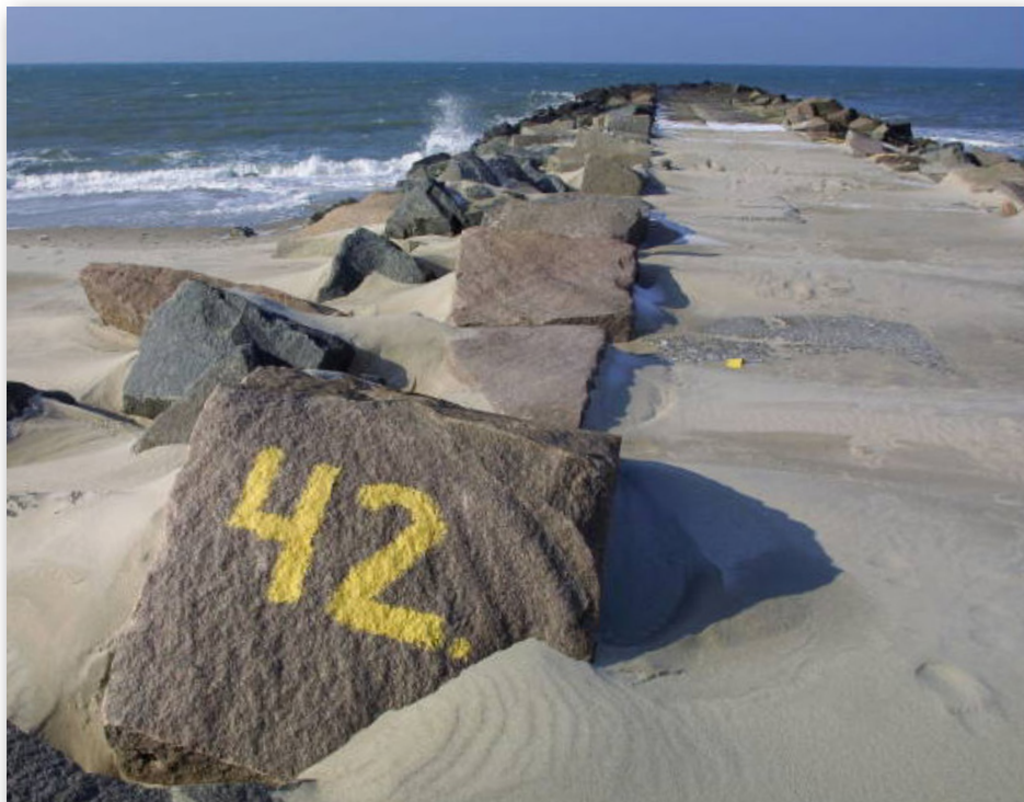
Cheminovas gamle fabriksgrund ved Harboøre Tange samt udbredt forurening ved Høfde 42 er tilsammen beregnet til en oprydningspris på 500 mio. kroner.

Samtlige ti partiers miljøordførere har på et møde krævet, at regeringen finder penge til at få ryddet op efter fortidens syndere, hvoraf de største findes i Jylland, bl.a. efter Cheminovas gamle fabriksgrund på Harboøre Tange til 1,04 milliarder, Grindstedværkets udkørsel med forurenede jord, Høfde 42 ved Harboøre Tange til 250 mio. kr., Kærgård Klitplantage til 82 mio. kr.