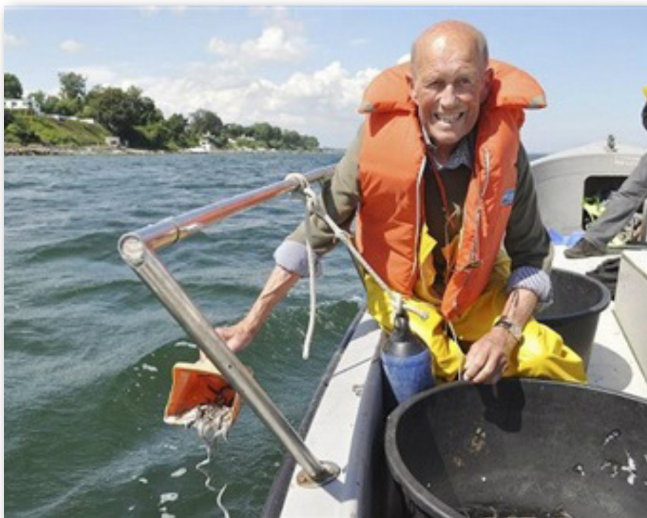
De fleste sætteål bliver udsat fra båd, her arkivfoto fra udsætninger i Østersøen fra Vedbæk.

områder, i vandløb og søer. For at genopbygge bestanden har Danmark og en række europæiske lande med opvækstområder for ål udarbejdet